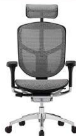
T168 B2 銀白色