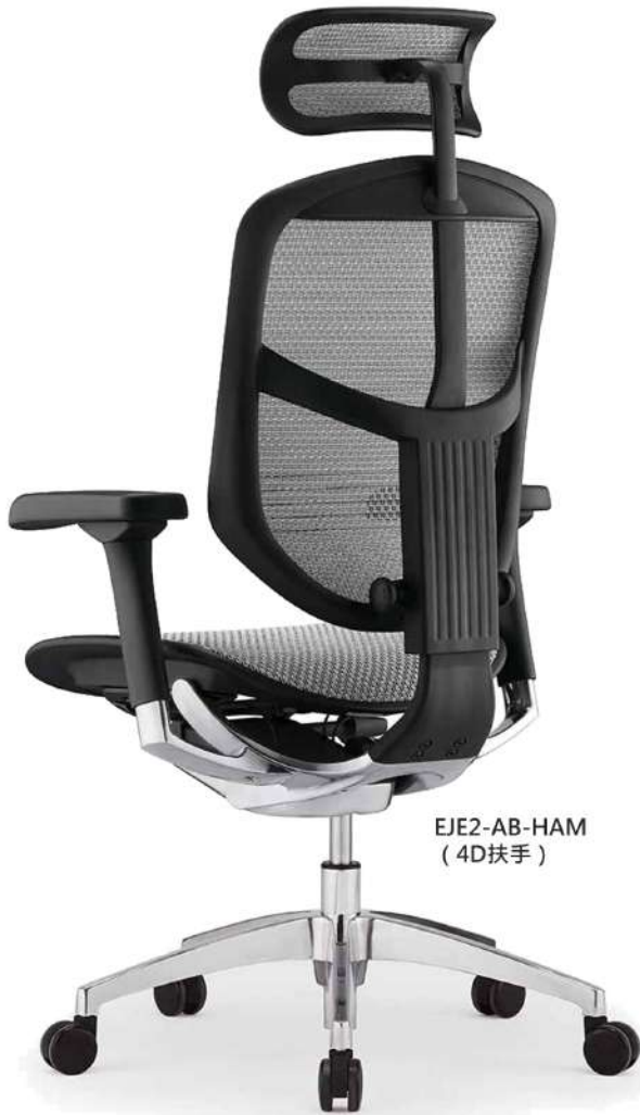
EJE2-AB-HAM (4D 扶手)