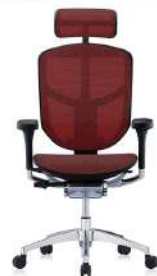
T168 B3 紅色