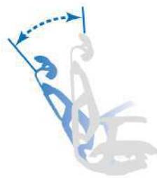
桿鍵後推：椅背後仰 桿鍵居中：鎖定

集座高、座深、傾仰調整於一體，更符合人體工學的交互操控習慣，輕輕撥動指尖即可完成座椅姿態調整。