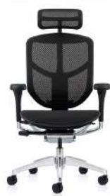
T168 B1 黑色