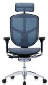
T168 B4 藍色