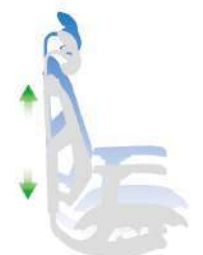
桿鍵上推：座椅高度