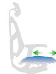
桿鍵前推：座深滑動 桿鍵居中：鎖定