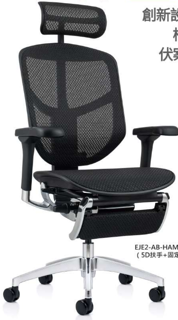
EJE2-AB-HAM-5D-LM (5D 扶手 + 固定腳凳)