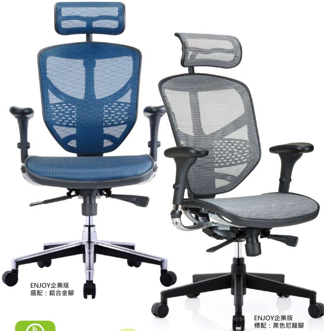
ENJOY企業版 選配：鋁合金腳