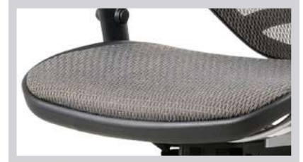
舒適透氣彈性網布