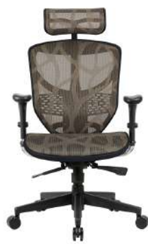
ZB8咖啡色 (美國雲彩網)