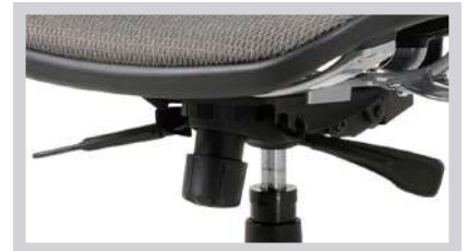
椅背回彈力度可調式設計